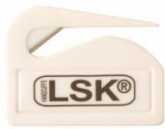
Coupe menottes : 5,00 € TTC