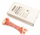
Boite de 40 mèches rouge cal 5.56 : 3,20 € TTC

KIT NET ARM Procédé révolutionnaire pour le nettoyage en toute sécurité du canon de vos armes à feu. Supprime l'emploi de brosse et écouvillon traditionnel Ecologique Ultra-résistant Performant 1 baguette 70 cm 1 x 8 mèches rouges