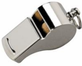
Sifflet chrome : 4,50 € TTC